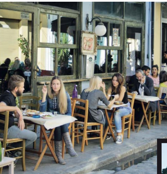
LINKSBOVEN Gezelligheid troef in Ladadika MIDDEN Hagia Sophia RECHTS De Witte Toren aan zee