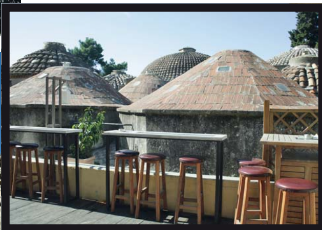
LINKSBOVEN Streetart zorgt voor kleur op straat en inkomen voor de kunstenaar LINKSONDER Byzantijnse kerk en hierboven de Bey Hamam met koepeldaken